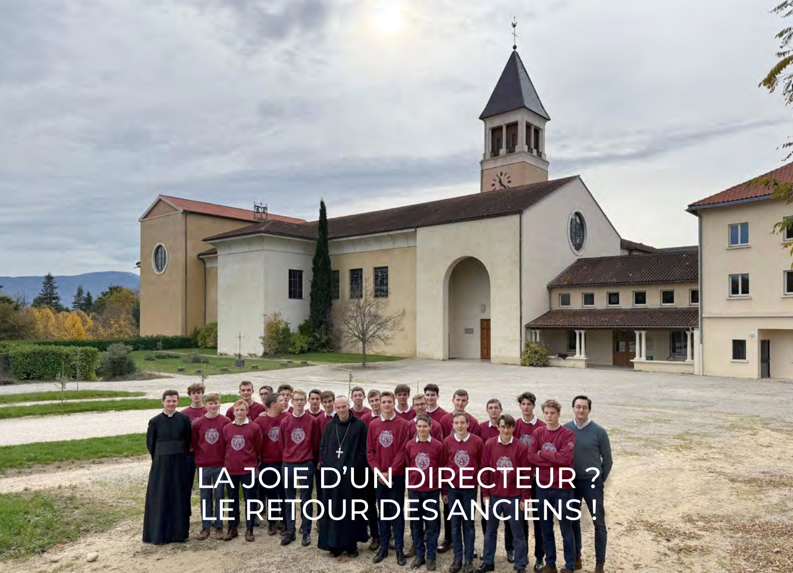
Retraite des Terminales à Triors

U n vendredi soir probablement ordinaire dans la vie d'un directeur. Un soupçon de fatigue se fait sentir au moment de repenser au rythme intense de la semaine passée. Quelques regrets ou quelques doutes surgissent en repensant à des décisions récentes. Un peu de vertige aussi, en pensant aux échéances de la semaine à venir. Le démon rôde, rugit, proposant lassitude et découragement. Seigneur, pour quoi cette mission, pour quoi un tel investissement ? Le temps d'une oraison jaculatoire, et le Ciel apporte une réponse : un ancien frappe à la porte de mon bureau. « Bonjour Monsieur, avez-vous un peu de temps à m'accorder ? Je voulais vous remercier et vous donner des