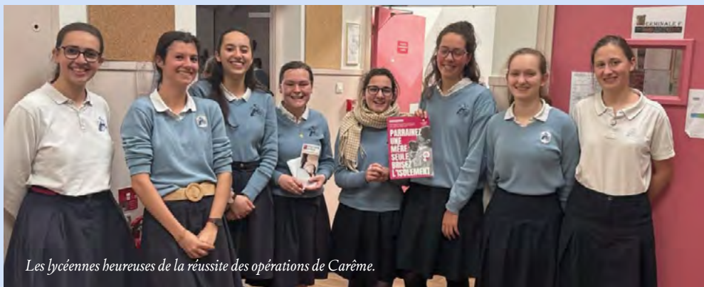
Les lycéennes heureuses de la réussite des opérations de Carême.

Vivre le Carême à l'école, c'est prendre des résolutions et bien sûr prier le Rosaire, organiser un Chemin de Croix ou y assister, supprimer quelques douceurs... mais aussi l'occasion de sensibiliser nos élèves à des actions en faveur des plus démunis ou des plus fragiles. Ainsi, l'an dernier, le secondaire s'était mobilisé pour la Fondation Jérôme Lejeune.