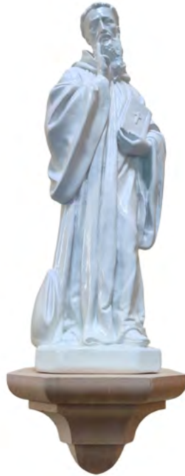
Photo ci-dessus : Statue de saint Benoît installée en bonne place au secondaire garçon

C'est pourquoi saint Benoît trouve opportunément sa place en nos murs pour édifier avec nous la cité terrestre, par la transmission des sciences et de la culture que nous ont léguées ses moines afin de peupler le Ciel par la prière, l'étude et le travail.