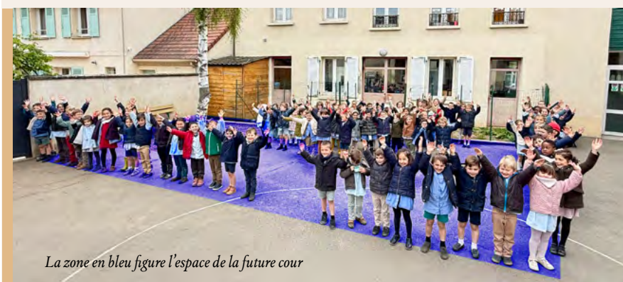
La zone en bleu figure l'espace de la future cour

Les élèves de maternelle (actuellement 94) évoluent aujourd'hui dans un espace partagé avec les élèves du primaire. Sans être problématique en soi, cette organisation n'est pas pleinement adaptée à leur âge. La petite section, ouverte il y a deux ans avec succès, renforce aujourd'hui le besoin de créer une cour spécifiquement dédiée à la maternelle qui permettra d'offrir un environnement plus calme, plus sécurisé et mieux ajusté à leurs besoins.