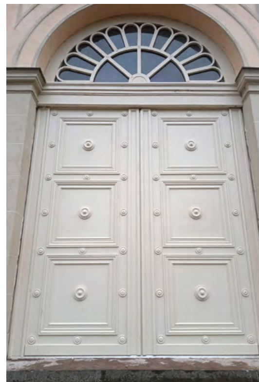
Evrard Coppens et l'une de ses magnifiques réalisations.