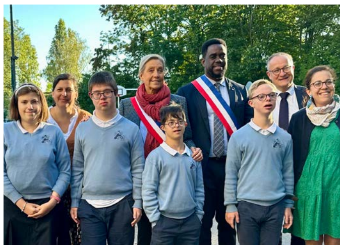
La classe avec les maires du Pecq et du Port-Marly