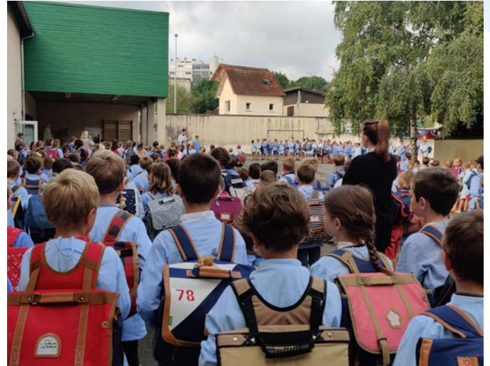
Rentrée des classes au primaire

L'engagement des professeurs se matérialise notamment par leur investissement qui va bien au-delà de leur mission première. Conscients qu'ils exercent d'abord au sein d'une œuvre, nombreux sont ceux qui contribuent aussi bénévolement à la vie quotidienne de l'école en développant des projets artistiques avec les élèves, en assurant les surveillances des récréations ou des repas, en organisant des visites culturelles, ou encore en collaborant avec les parents aux grands événements de l'année (vente de Noël, kermesse...).